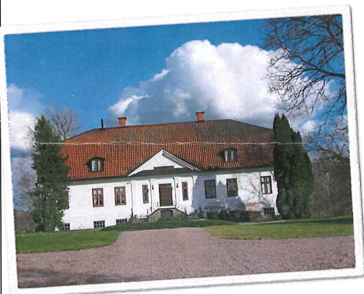
Kulltorp idag.